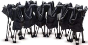
◀◀ LIFT & PULL/SOULEVEZ ET TIREZ